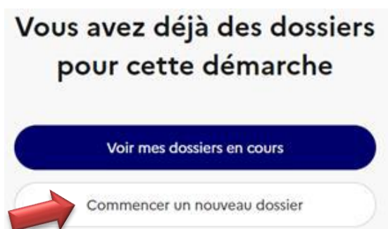
Figure 2 : Commencer un nouveau dossier (page d'accueil)